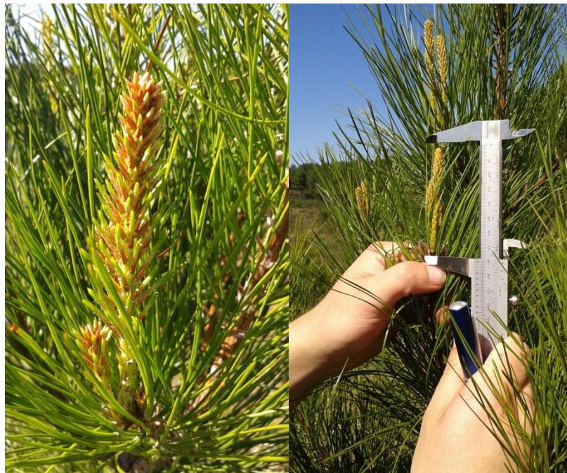
Figura 2 – Brotação de Pinus em pleno desenvolvimento vegetativo, com comprimento médio entorno de 15cm, Caçador-SC, 2018.

Avaliou-se o crescimento e desenvolvimento das plantas a cada sessenta dias após a realização da desrama, por um período de um ano, totalizando seis avaliações, para que essas novas medidas fossem comparadas com as medidas iniciais e assim proporcionassem uma resposta a respeito da intensidade de desrama mais indicada para plantios de Pinus taeda . A altura das plantas foi mensurada com réguas de madeira graduadas e paquímetro e a medida do diâmetro do tronco foi tomada com paquímetro, em três pontos (0,5m, 1,0m e 1,5m) a partir da base das plantas.