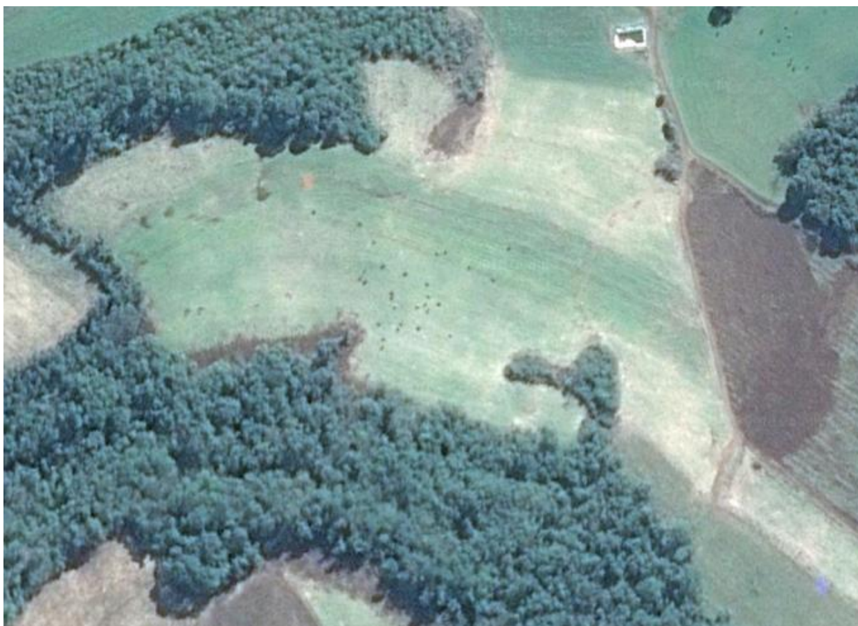
Figura 1. Localização da propriedade em Rio das Antas – SC. Figure 1. Location of the property in Rio das Antas - SC.

A área agricultável são 32 hectares, na qual são praticadas as atividades de plantio de milho, hortaliças em geral e criação de gado de leite, sendo esta última a principal atividade da propriedade.