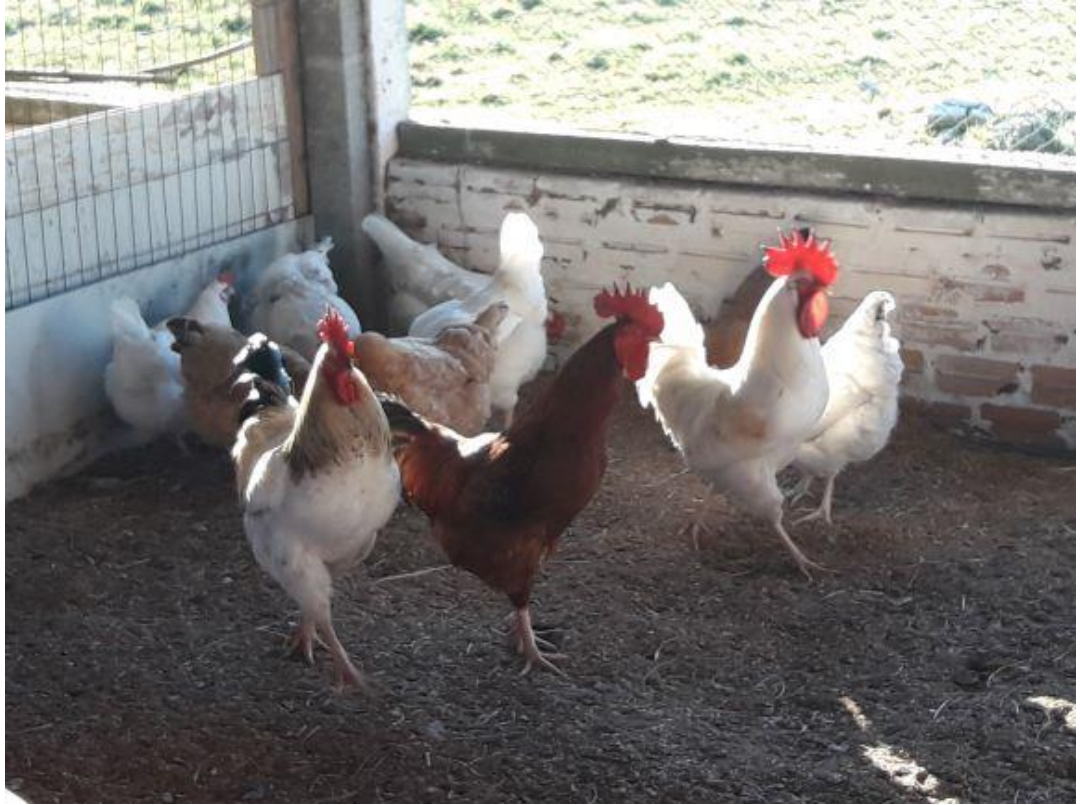
Figura 1. Galinhas caipiras criadas no Sistema Caipira. Figure 1. Free-range chickens raised in the "Caipira" System.

As aves foram manejadas em um aviário de alvenaria dotado de cama de casca de arroz (Figura 2), ninhos de postura, comedouros tubulares, bebedouros pendulares, poleiro e piquete.