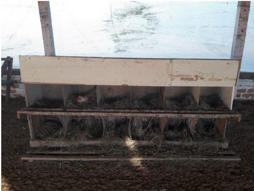
Figura 2. Galpão das galinhas caipiras poedeiras com cama de casca de arroz e ninhos. Figure 2. Shed of free-range laying chickens with rice husk beds and nests.

Os ovos coletados foram estocados em temperatura ambiente, por três períodos distintos. Assim, os tratamentos (T) foram formados conforme o período de estocagem dos ovos. Os períodos de armazenagem dos ovos foram: 1 a 4 dias (T1), de 5 a 12 dias (T2) e de 13 a 16 dias (T3). Na sala de estocagem foram mensuradas diariamente, às 9 horas, a temperatura ambiente (máxima e mínima) e a umidade relativa do ar.