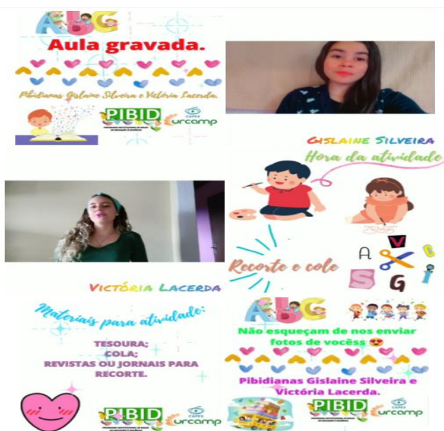
Figura 2: Imagens da aula enviada para a turma.