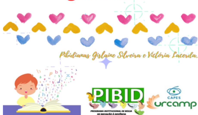
Figura 1: Convite enviado durante a semana via WhatsApp no grupo da turma. Arte: Bolsista Victória Lacerda.